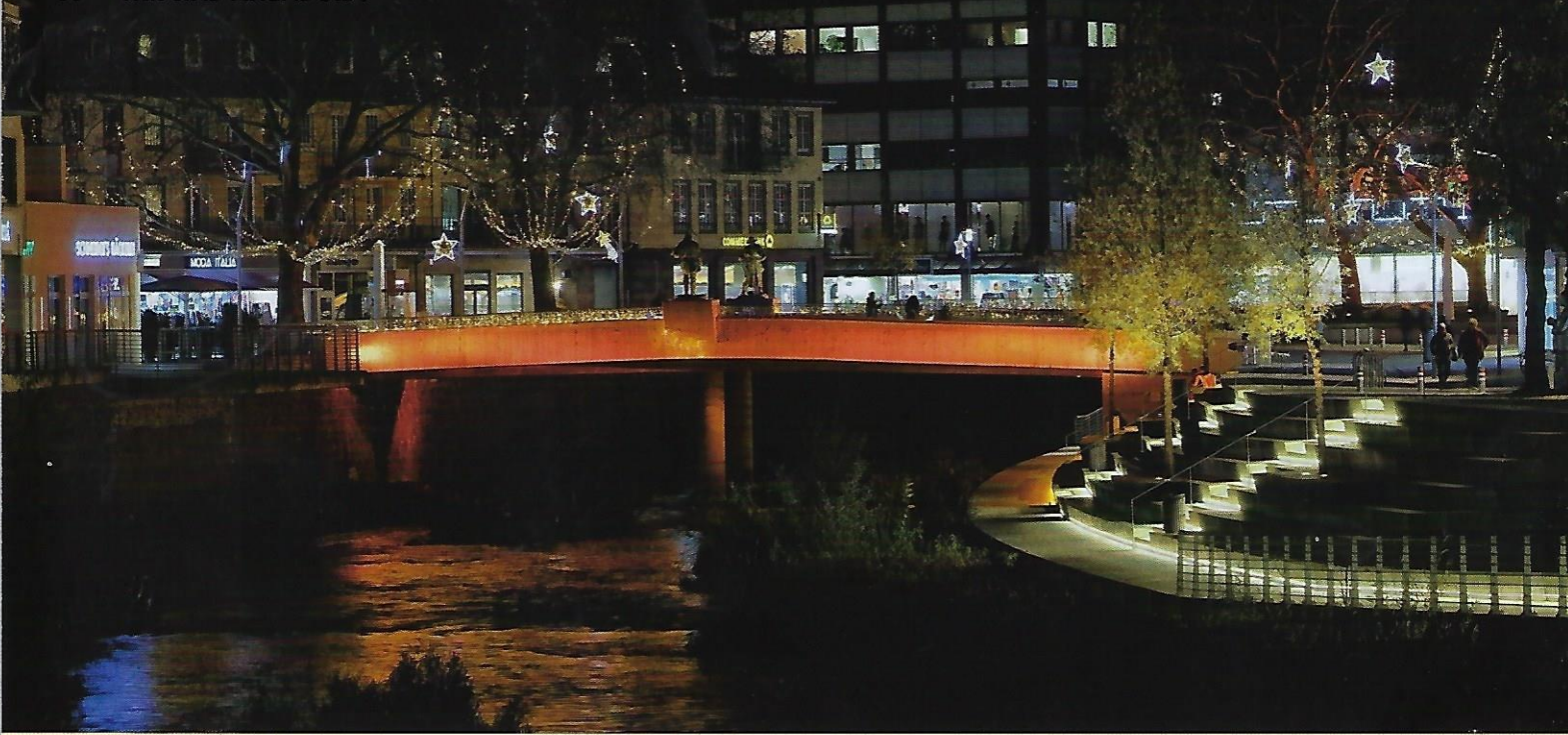
Auch das neue Siegufer in Siegen erstrahlt in einem knalligen Orange